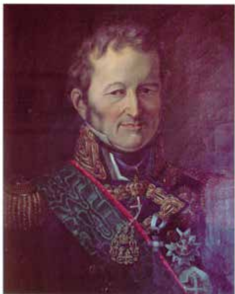
L'ammiraglio Giorgio Andrea Des Geneys.

redditi derivanti dai cosiddetti benefici di risulta. L'ammontare di tutte queste entrate si aggirava sulle 100 000 lire di Sardegna, (5) cifra che sarebbe poi rimasta pressoché invariata fino alla Restaurazione. Infine, sempre nel miglior stile anterivoluzionario, la Cassa della Marina aveva un'amministrazione separata da quella delle Finanze e delle altre casse e, in pratica, di tutti i soldi che riceveva e di come li spendeva Des Geneys rendeva conto direttamente e solo al Re.