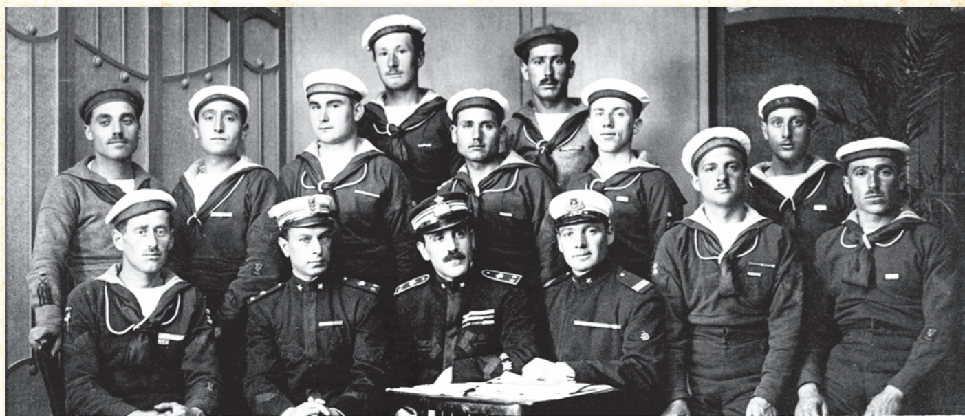
In alto: Luigi Rizzo con gli equipaggi dei Mas 15 e 21, protagonisti dell'Impresa di Premuda; in basso: il Mas 96 comandato da Rizzo nella "Beffa di Buccari" ed oggi conservato presso il Vittoriale degli Italiani (Foto Archivio Iconografico Fondazione "Il Vittoriale degli Italiani").

di Muggia, all'imboccatura del porto, egli staccò due pietre che, al ritorno a Grado, donò a Thaon di Revel, promettendogli un miglior "bottino", in futuro.