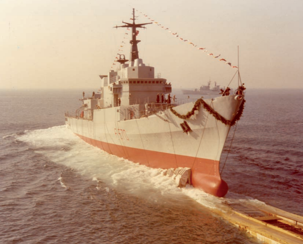
In alto: Riva Trigoso (GE), 2 febbraio 1981. Varo di nave Maestrale, la prima nave ad entrare in servizio dopo la Legge Navale. A destra: Monfalcone (TS), 4 giugno 1983. Varo di nave Garibaldi; prevista nell'ambito della Legge Navale fu la prima unità a tutto ponte della Marina.