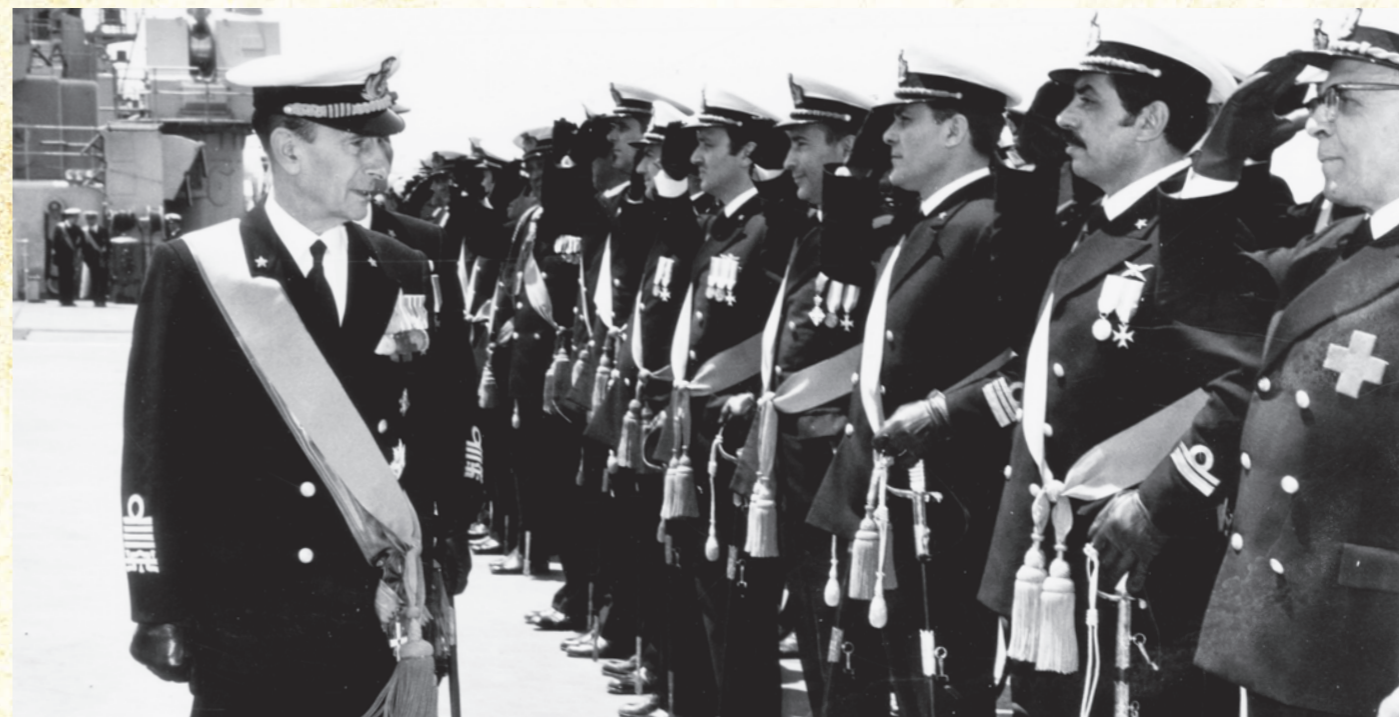
In alto: Taranto, 30 maggio 1973. L'ammiraglio De Giorgi passa in rassegna l'equipaggio del Veneto in occasione della cerimonia del passaggio di consegne del Comando della Squadra Navale all'ammiraglio Luciano Bucalossi.