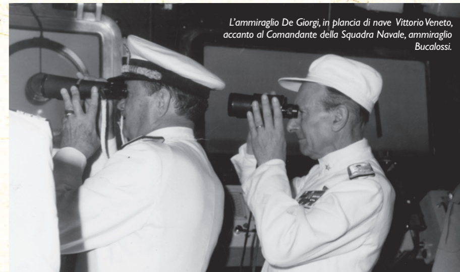
L'ammiraglio De Giorgi, in plancia di nave Vittorio Veneto, accanto al Comandante della Squadra Navale, ammiraglio Bucalossi.