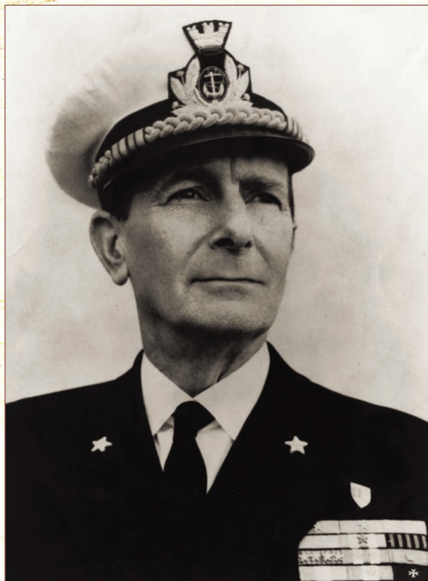
L'ammiraglio di squadra Gino De Giorgi, capo di Stato Maggiore della Marina dal 5 maggio 1973 al 17 luglio 1977.

vuoi continuare a leggere? clicca qui per le modalità di abbonamento