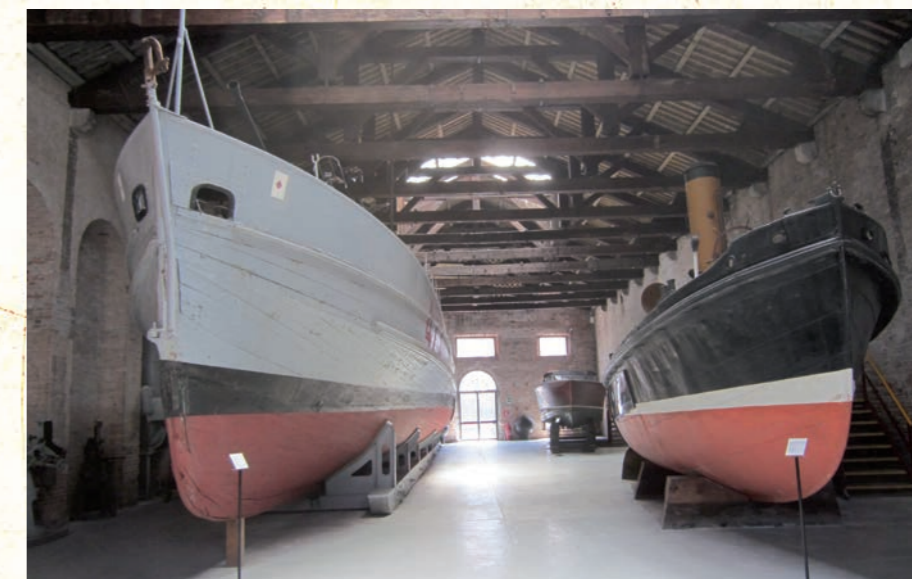
presa di Capo Spartivento del 15 agosto 1943. Sotto: l'unità MS 473 a sinistra (già MS 31), musealizzata, per volontà dell'ammiraglio De Giorgi, nel Padiglione delle Navi del Museo Storico Navale di Venezia.