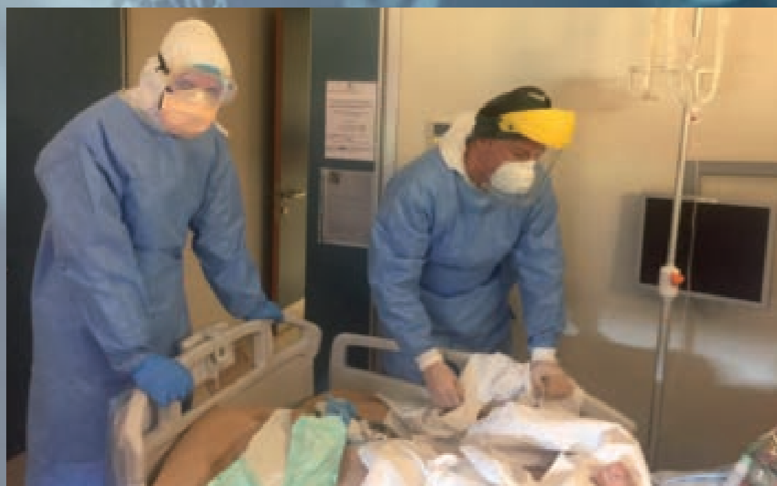
Personale sanitario della Marina presta le cure a una degente.

Convinto che, “come dicevano anche gli antichi medici, un sorriso non si deve mai negare, né al paziente né al collega”, racconta di uno di quei momenti di relazione tanto utili ad allentare la tensione, come può essere mangiare uno spicchio di pizza tutti insieme al momento del cam-