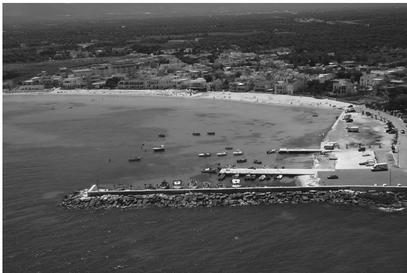
Ved. 14a - Torre Canne - Porticciolo (2004)