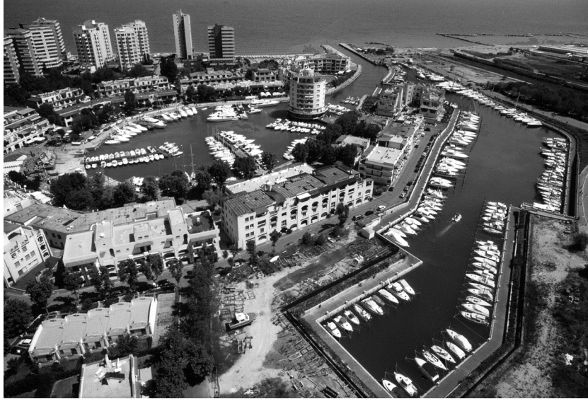
Ved. 43a - Porticciolo di Portoverde (2005).