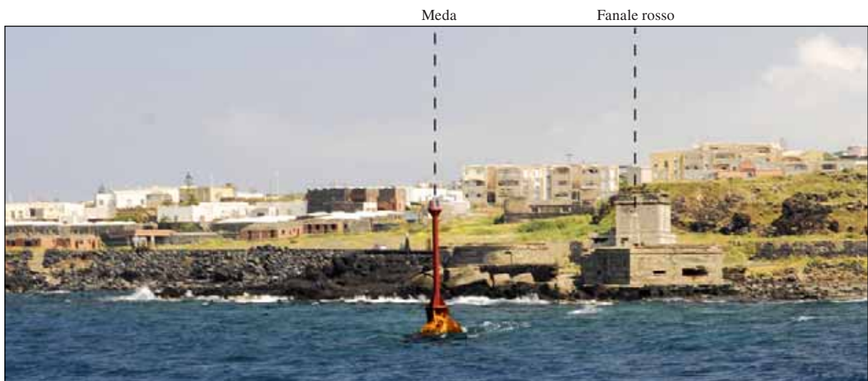
Figura 11 - Secca di Punta San Leonardo (2010)