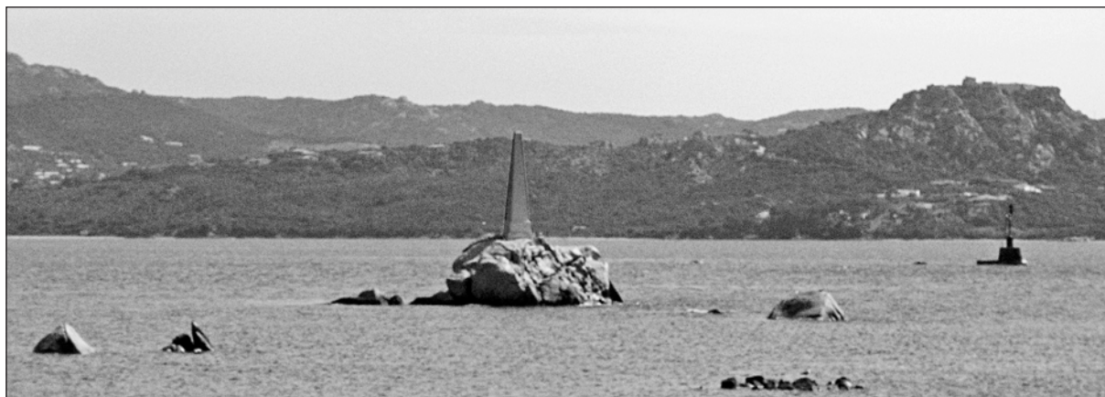
Figura 22c – Scoglio Bianco (2009).