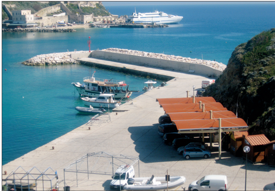
Figura 27 – Porticciolo di S. Domino (2011).