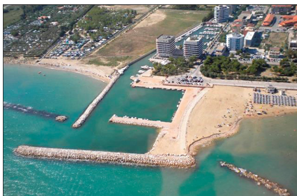
Figura 40a - Porticciolo turistico Le Marinelle (2012).».

« Le Marinelle - E' un porticciolo turistico sito nel comune di S. Salvo, realizzato scavando una darsena all'interno della costa. Dal largo si può riconoscere per gli alti edifici che sorgono a NW dell'imboccatura (Figura 40a).